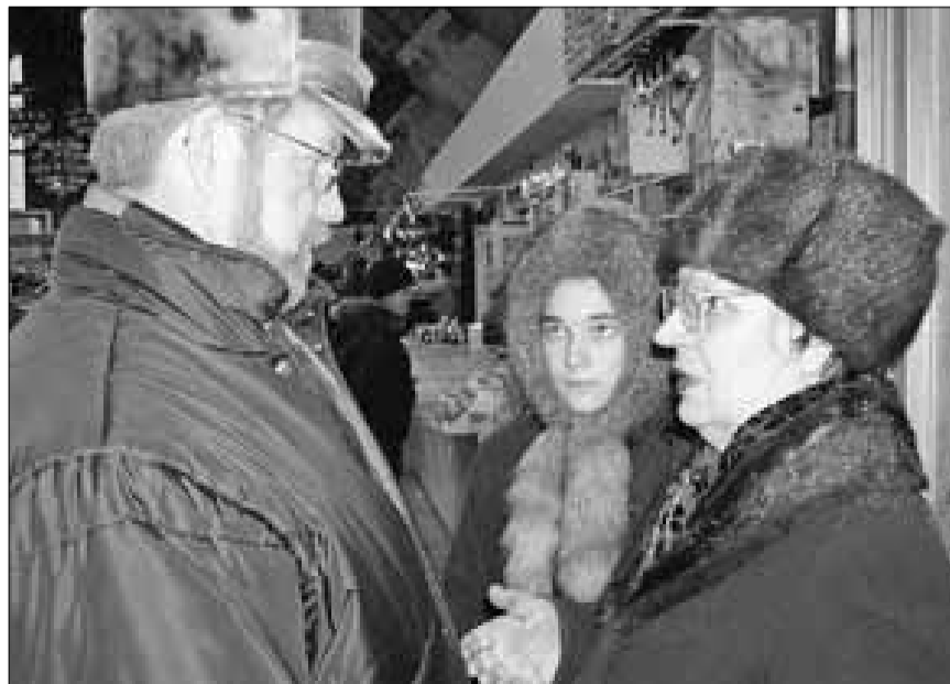
■ От проблем жителей Ефремов никогда не отгораживался

Во второй половине дня рабочая группа администрации переехала в Ко-