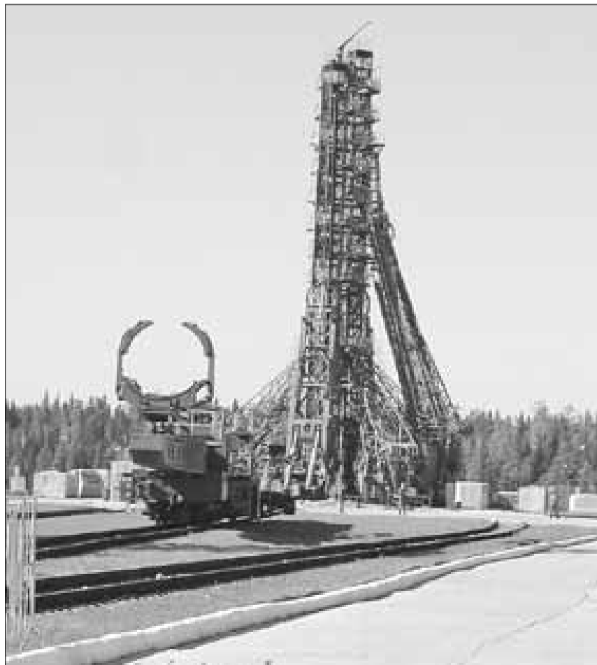
■ Космодром «Плесецк» – гордость области и вместе с тем боль жителей Мезени, куда падает космический мусор