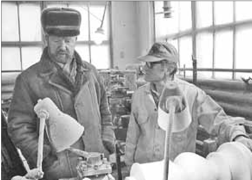
■ Малый бизнес занял лидирующие позиции в мебельном производстве

В ходе совещания прозвучало, что космодром «Плесецк» функционирует на территории Архангельской области более сорока лет, за это время отсюда было произведено более двух тысяч запусков ракет, причем с 1993 года с «Плесецка» выводятся на околоземную орбиту и зарубежные космические аппараты, естественно, на коммерческих началах. Но проблема компенсаций за использование районов падения отделяющихся частей не отрегулирована. Слабо изучено влияние космодрома, компонентов ракетного топлива на здоровье населения поморских сел, куда регулярно падает космический мусор.