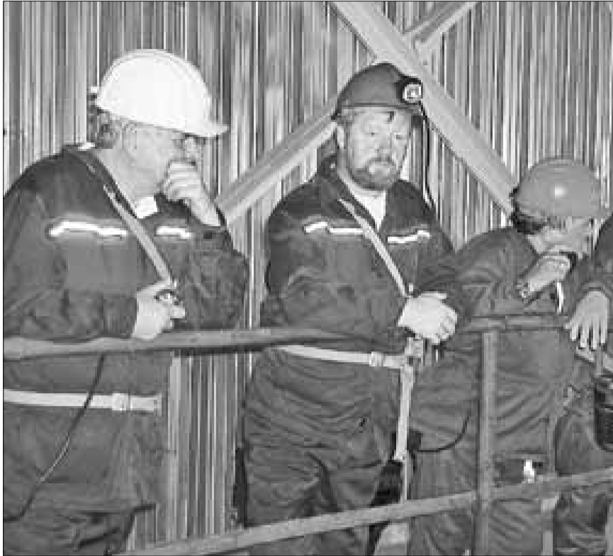
■ Освоение подземных кладовых Поморья

строить здание старой фермы, где работало более 30 человек. Если два года назад удои составляли 2-4 литра молока от одной коровы, то теперь они возросли до 15 литров. На ферме была и своя звезда – корова Зычная, которая давала до 21 литра молока.