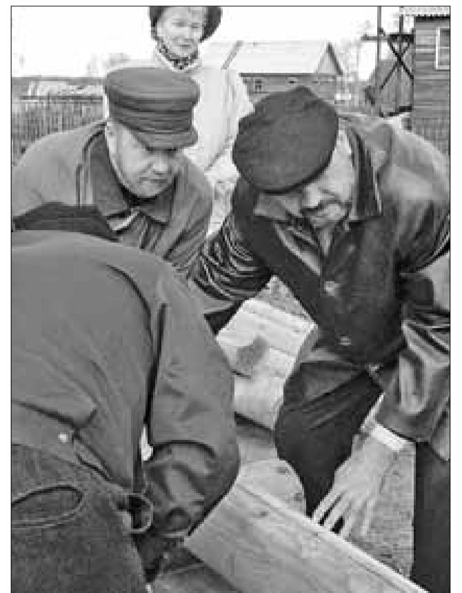
■ Будущий храм в Тойнокурье: первые бревна помогает укладывать сам губернатор