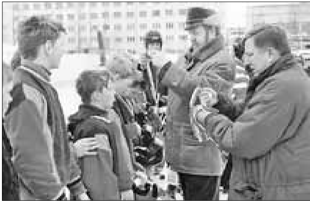
■ Юные хоккеисты – достойная смена «Водника»