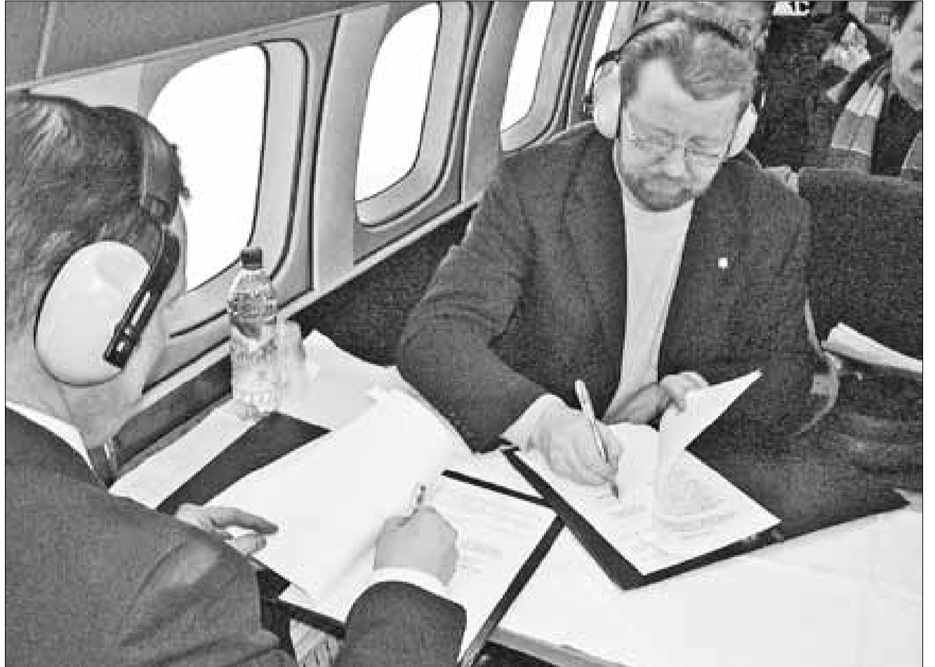
■ Договор о сотрудничестве с Республикой Карелия подписывается в вертолете

нешнего положения. Средний заработок квалифицированного столяра на фабрике составлял 7-8 тысяч рублей, а некоторые мастера – золотые руки зарабатывали до 15 тысяч рублей в месяц. Губернатор заметил, что директора частных предприятий быстро усвоили истину, которую никак не могут осознать некоторые главы районов: «Сегодня без своевременной и достойной оплаты труда трудно требовать от работников добросовестного выполнения своих обязанностей».