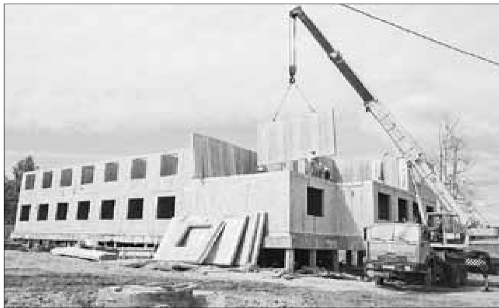
Строительство второй очереди домов на улице Конзихинской.

Актуально: В Архангельске возводят социальные объекты и планируют проекты на перспективу