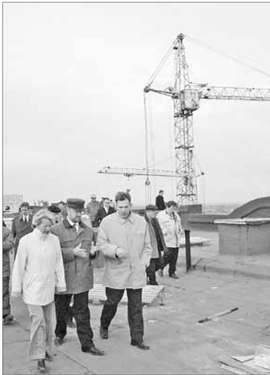
■ На строительстве хирургического корпуса областной больницы

Через две недели в выходные дни губернатор решил проверить, как исполняется его указание. Дело в том, что область перевела заказчику – муници-