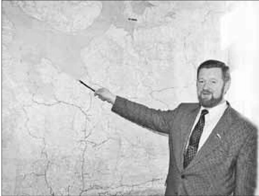
■ Глава региона

подготовке здания к зиме на своей технике, что значительно сокращает расходы по обслуживанию зданий. На их участке практически нет задолженности по квартплате.