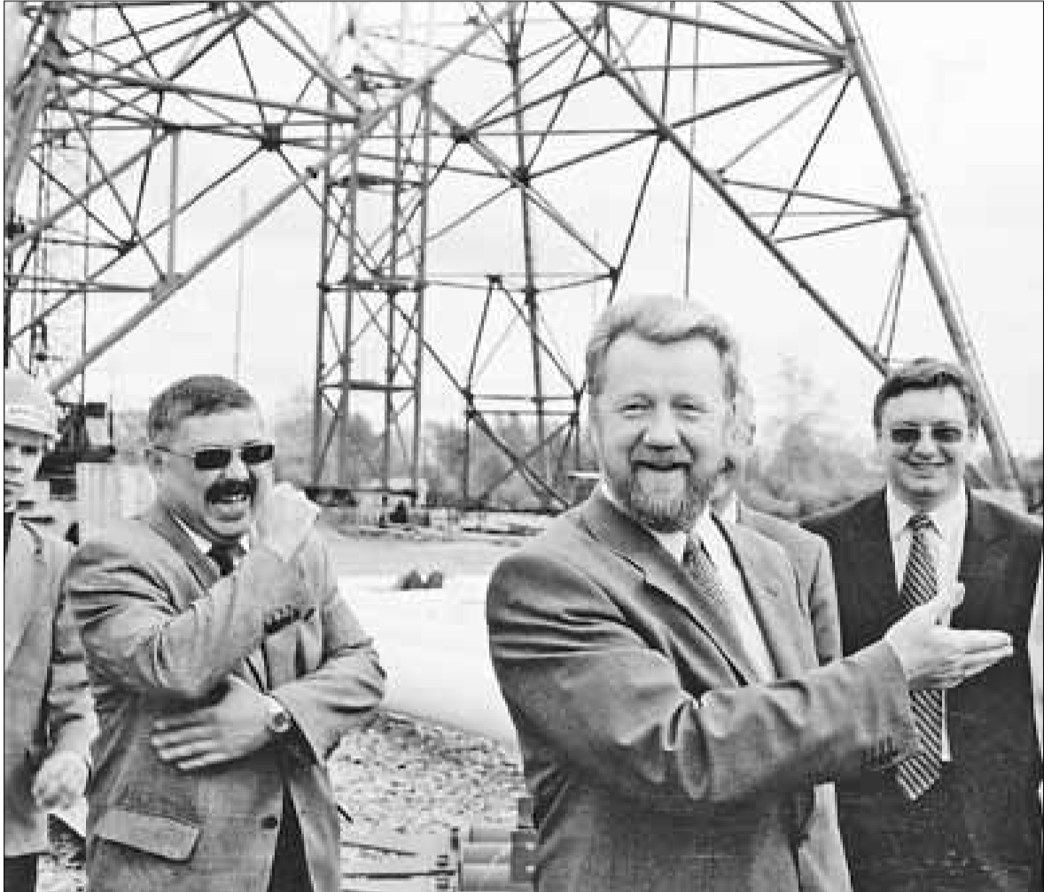
■ На строительстве телевышки в Архангельске

Представляю его, такого хелевого, верхом на ящиках. И себя рядом – в бархатном плаще и на