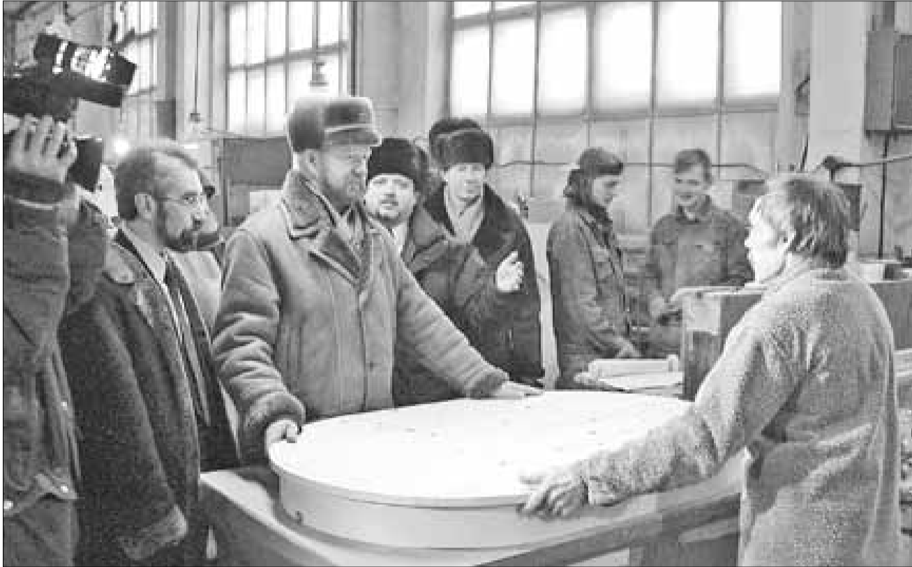
■ Визит губернатора на северодвинские мебельные предприятия

осмотрев строительство, поставил задачу: открыть движение автобусов к первому населенному пункту Мезенского района – деревне Совполье – к осени 2003 года.