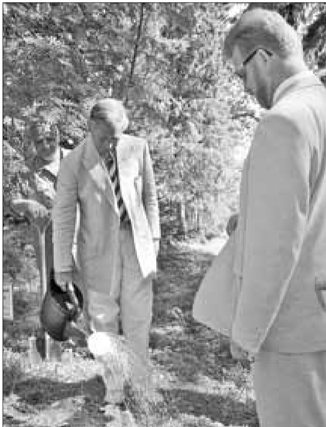
■ 16 июля состоялся визит Его Королевского Высочества принца Уэльского Чарльза

из России. Достигнута договоренность о приезде швейцарской делегации в Северодвинск в ближайшие месяцы.