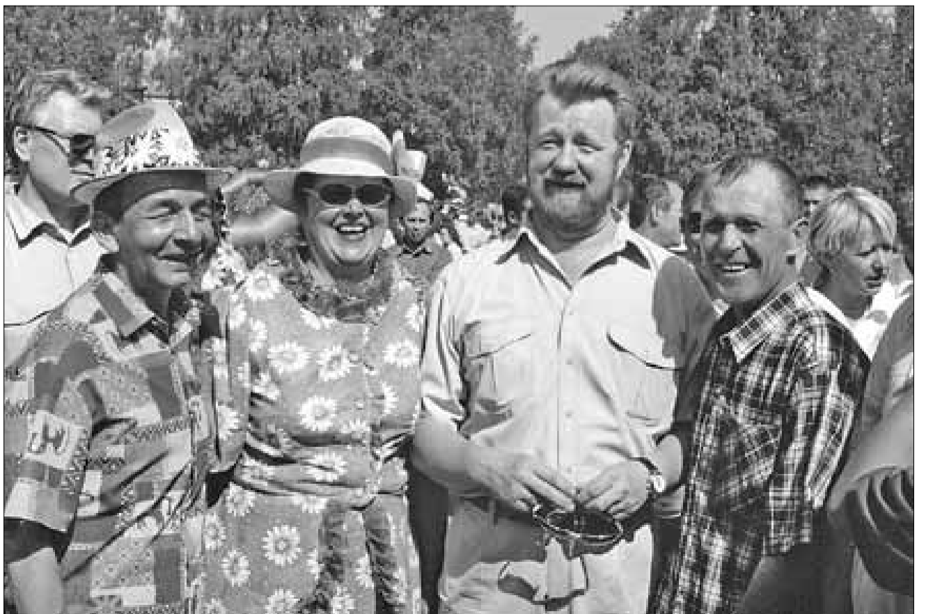
■ Жители Котласа, Коряжмы и Сольвычегодска радушно принимают губернатора на фестивале Козьмы Пруткова