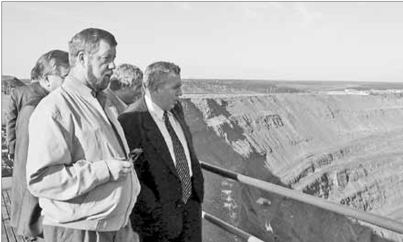
■ Алмазодобывающие карьеры АЛРОСЫ

ряжму, где в местной администрации прошло совещание на тему «Перспективы развития Котласского транспортного узла». В ближайшие годы через Котлас и Архангельск должны резко вырасти объемы грузоперевозок и, в первую очередь, нефти. Для этого все должно было быть готово.