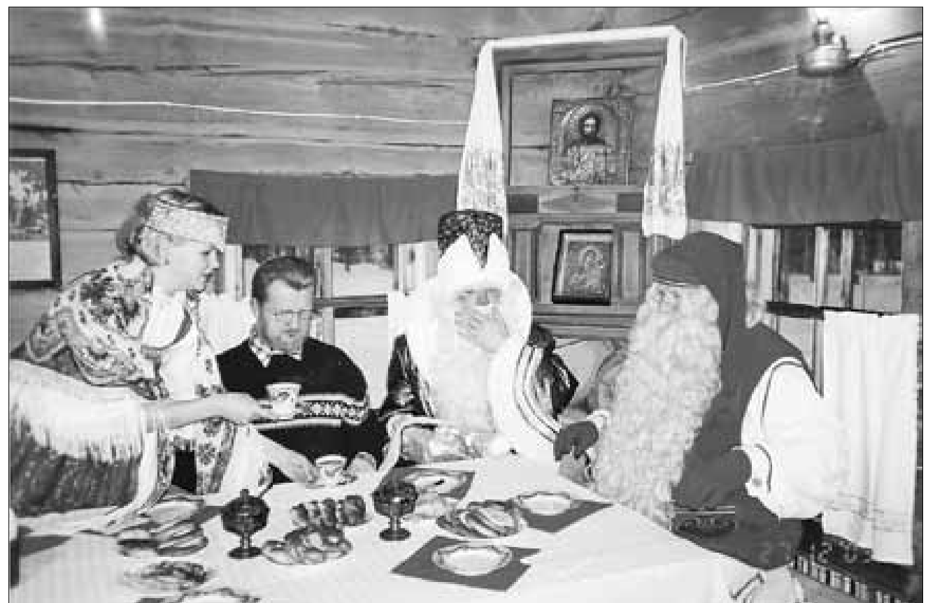
■ Дед Мороз из Великого Устюга и Санта-Клаус из финского Рованиemi – гости архангельской земли