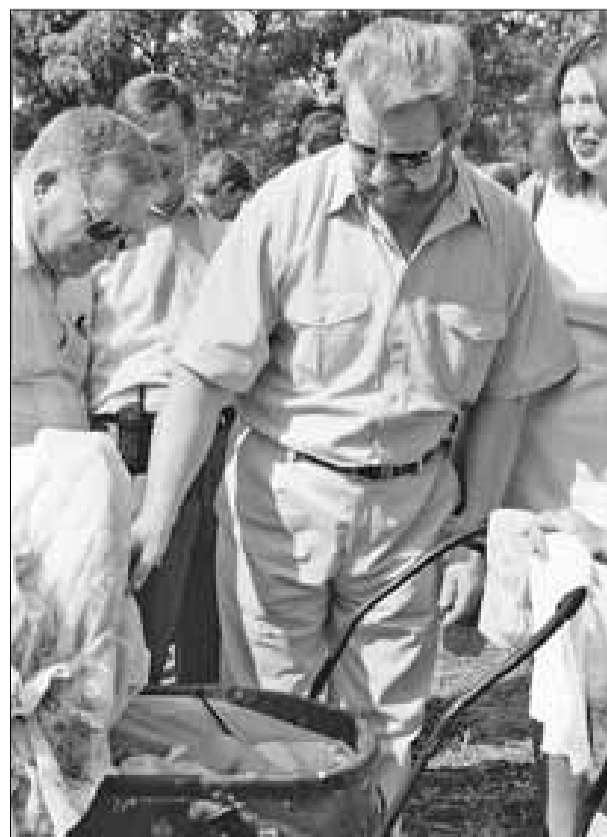
■ На Прокопьевской ярмарке в Сольвычегодске губернатор и местные жители познакомились с новорожденными жителями области