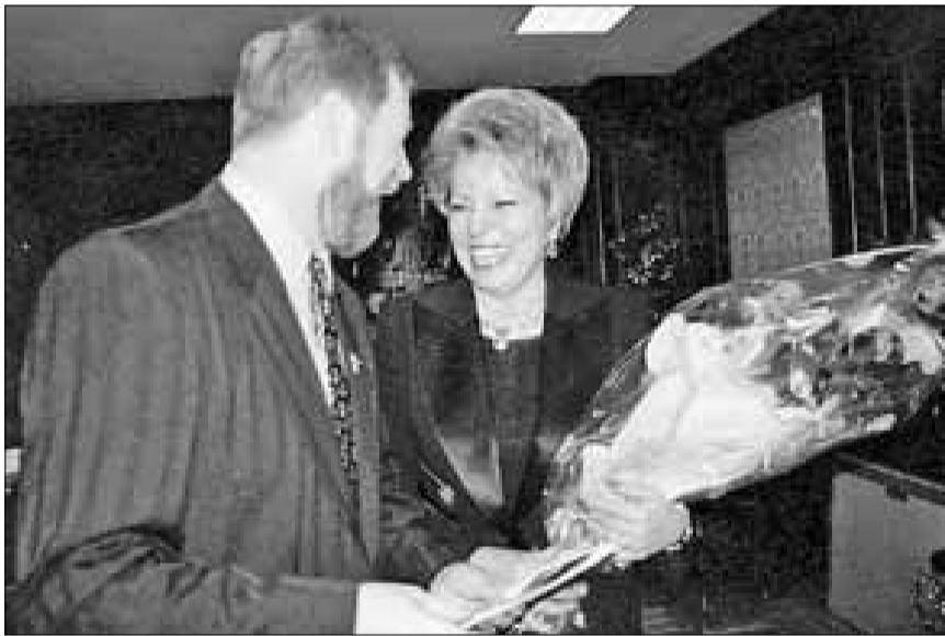
■ Валентина Матвиенко – цветы радуют даже «железную» леди