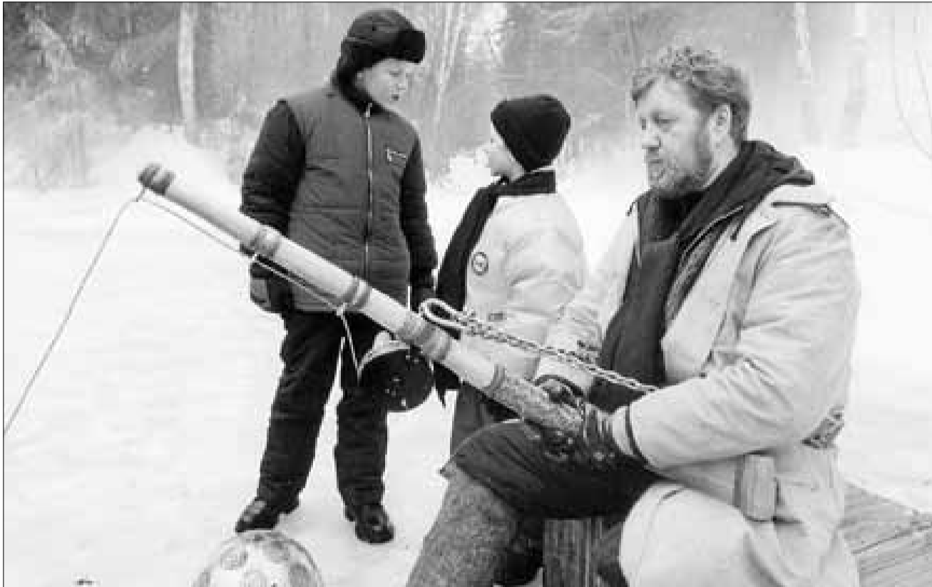
■ На съемках кинофильма «Вовочка», где Ефремов сыграл роль рыбака-помора

«Ценности современного образования. Региональный аспект», в конференц-зале администрации работала Всероссийская научно-практическая конференция «Стратегия развития Северных регионов России».