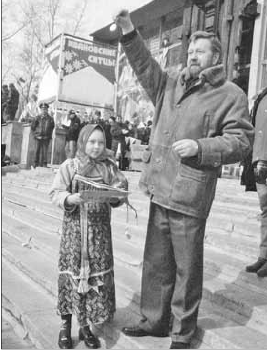
■ 2003-й тоже объявлен Годом предпринимателя. Маргаритинская ярмарка собирает все больше участников