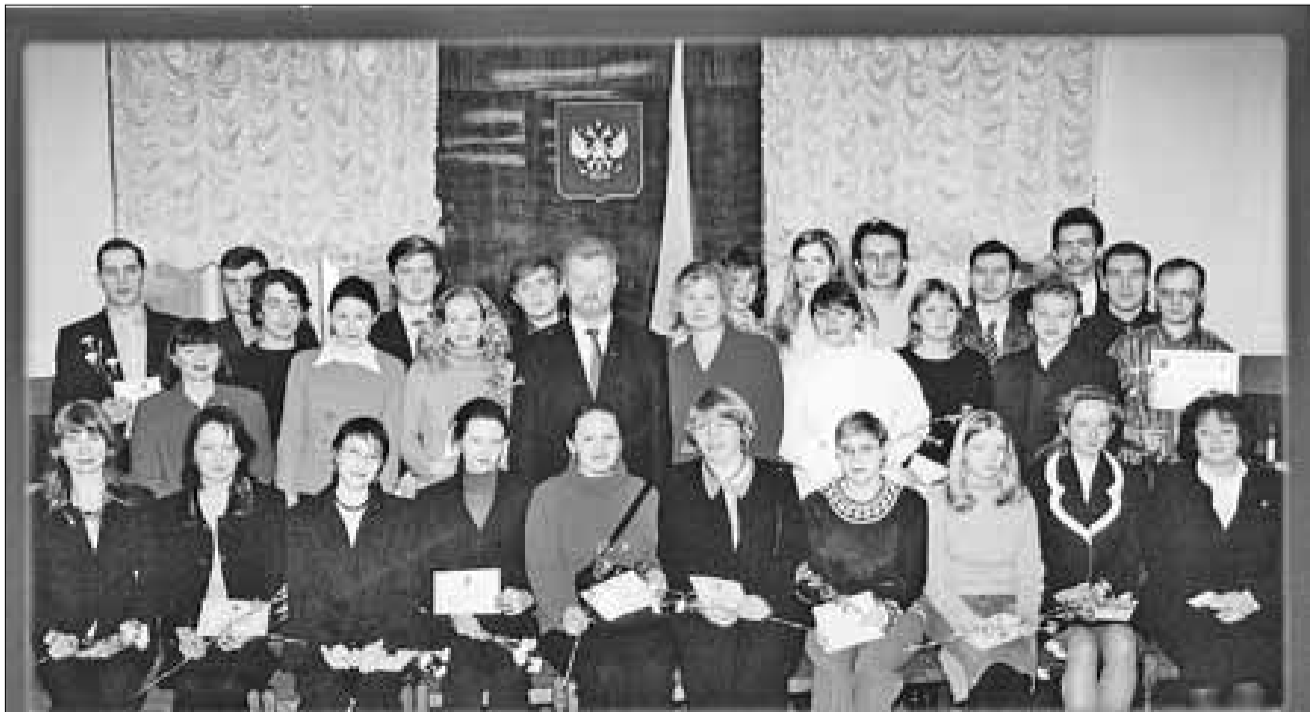
Победители областного конкурса научных работ молодых ученых за 2003 год